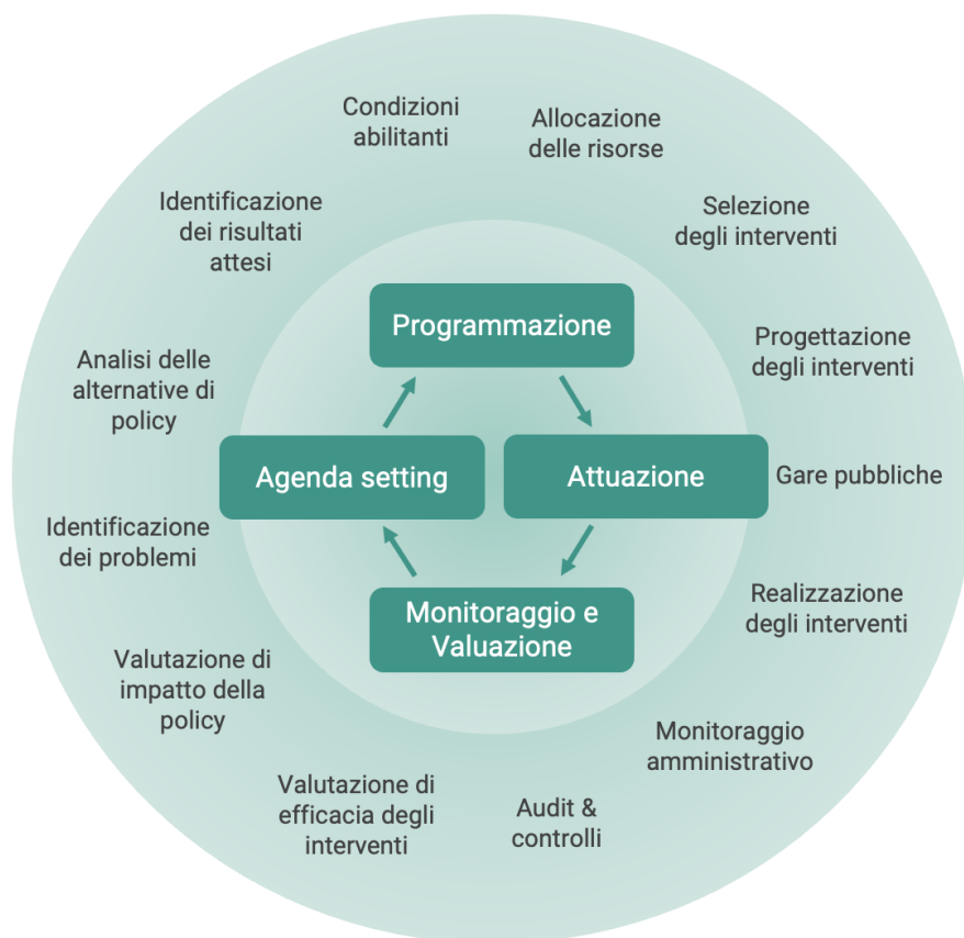
Fig. 1 - Fasi del ciclo di policy

Adattato da Macintosh, 2004 e Osimo, 2021