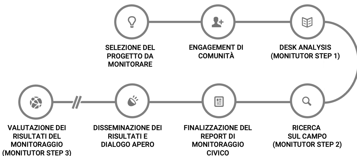
Fig. 2 - Fasi del monitoraggio civico dei progetti pubblici

Il metodo di Monithon si compone di 7 fasi, di norma conseguenti l'una all'altra. Si tratta di un metodo via via migliorato a partire da un primo tentativo di costruzione di una "scheda di monitoraggio civico" a gennaio 2013, e consolidato già da alcuni anni, garantendo quindi la comparabilità nel tempo dei risultati.